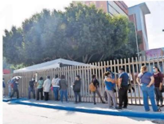
Una de las dos variantes californianas estaría detrás de la segunda ola de contagios que vivió Baja California en los meses de noviembre de 2020 a enero de 2021