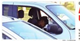
TECATE.- El ataque ocurrió en el centro comercial Las Olivas, ubicado en bulevar Universidad.

EN EL IEEBC APRUEBAN LINEAMIENTOS PARA DEBATES ELECTORALES